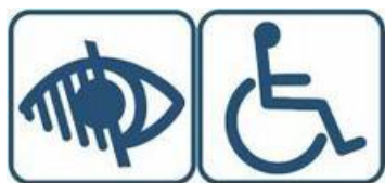
Pictogramme des handicaps visuel et moteur

Visite guidée, groupe adulte ou jeune public sur réservation.