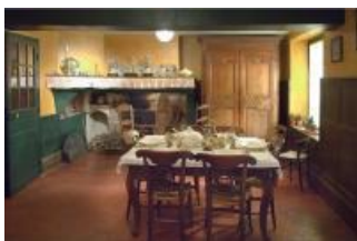
Maison de Pierre Mac Orlan, la salle à manger en rez-de-jardin