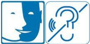
Pictogrammes des handicaps mental et auditif

Visite guidée, groupe adulte et jeune public. Visite découverte de l'univers intime d'un écrivain témoin des grands événements du 20ème siècle et auteur du roman qui a inspiré le film « Le Quai des brumes ».