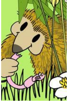
Dessin Olivier Schimmenti

Plongez dans la découverte des insectes et autres bestioles du quotidien de votre jardin. Aidez le hérisson à sauver vos laitues.