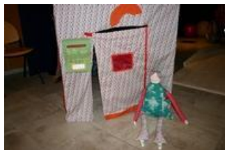
La maison de l'animation matières dans tous les sens

Visite-animation et atelier jeune public. Aussi impressionnante que la tornade du magicien d'Oz, une tempête a sévi dans le petit village de Saint-Cyr-sur-Morin.