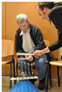
Invention d'une musique

Nul besoin d'être musicien, danseur ou chanteur ! Cette chanson collective est réalisée de manière spontanée à partir de signes lancés par un « chef-d'orchestre-compositeur ».