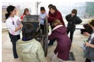
L'animation jus de pomme