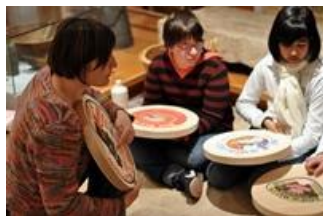
Animation "Fromage de Brie"

Visite-animation, groupe adulte et jeune public. Il s'agit d'une découverte des transformations de l'or blanc : le lait et ses différentes transformations comme celle du brie de Meaux.