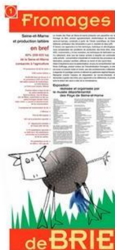
Exposition "Fromages de Brie"

Le musée départemental de la Seine-et-Marne présente une exposition sur le fromage de Brie, produit agroalimentaire emblématique du territoire seine-et-marnais, construite à partir de l'étude scientifique de Claire Delfosse, professeure des Universités à Lyon 2, membre du laboratoire LER de Lyon.