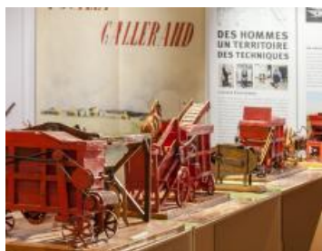
"Souvenirs mécaniques"