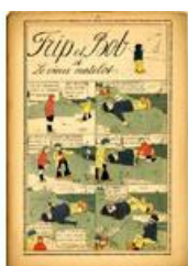
Pierre Mac Orlan in Almanach Nodot (1911)