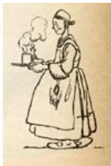
Dessin Gus Bofa