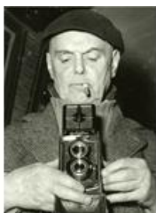
Photographie Pierre Mac Orlan

Le musée départemental de la Seine-et-Marne présente une exposition itinérante sur Pierre Mac Orlan et son parcours à travers les lieux, les rencontres, les arts qui jalonnèrent sa vie.