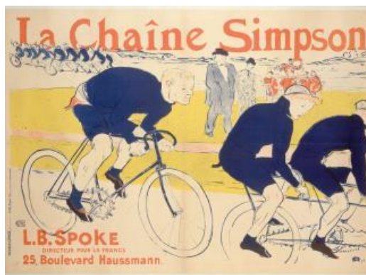
La chaîne Simpson, Henri de Toulouse-Lautrec, chromolithographie, 1896