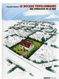
Le Bocage pavillonnaire

Par Pauline Frileux, Ed. Créaphis, 2013, 287 pages