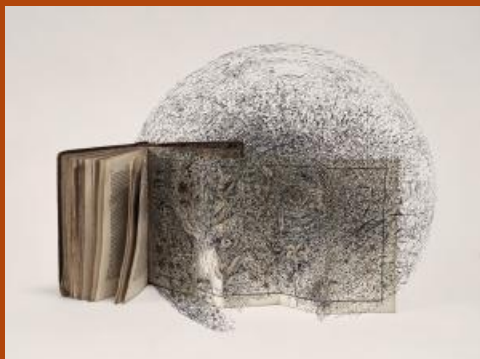
Ex-croissance © Bertrand Flachot - ADAGP

Bertrand Flachot a une pratique ouverte du dessin. C'est une immersion dans cet univers à la croisée de l'architecture et de la sculpture. L'exposition est présentée au MDSM du 13 février au 27 novembre, de 10h à 17h30, exclusive à découverte.